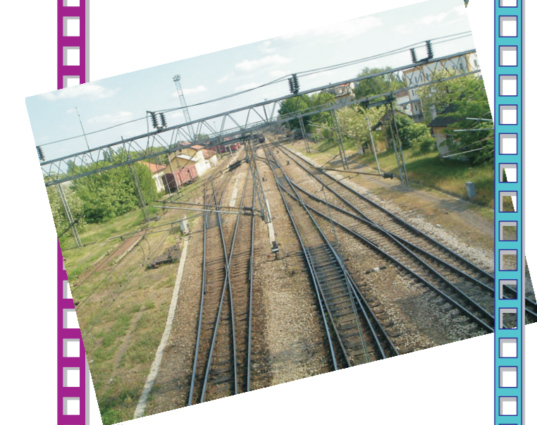
Železnički čvor u centru grada, slikan sa Majšanskog mosta A vasúti csomópont a város központjában a Majsai hidról