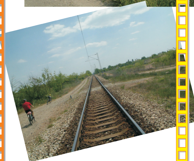
Biciklisti saobraćaj duž pruge za Budimpeštu Kerékpáros közlekedés a pesti vasút mentén