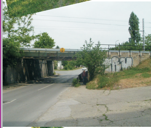
Ostatak pruge za Crvenku na stanicici Aleksandrovo A megszüntetett cservenkai vasút vágányai sándori állomáson