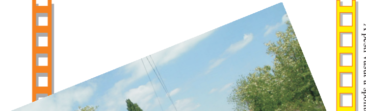
Pruga za Budimpeštu sa sazama pored A pesti vasút a sponda kerékpárutakkal