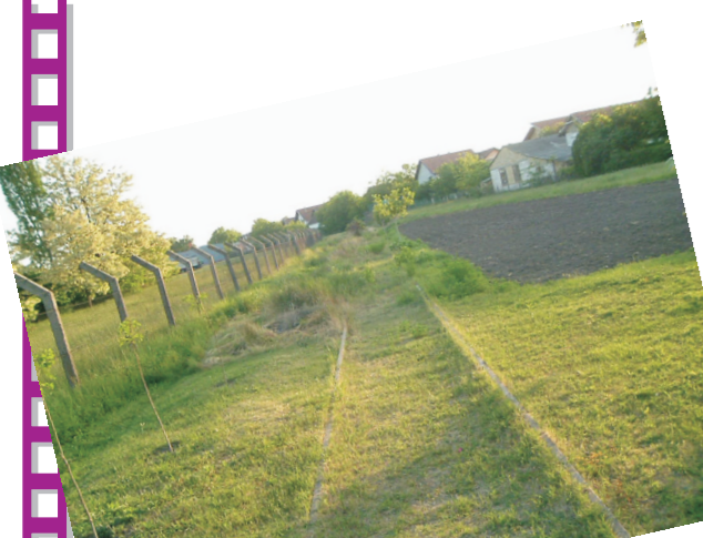
Ostatak pruge za Crvenku na periferiji grada A megszüntetett cservenkai vasút vágányai a város peremén